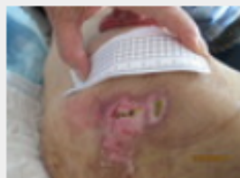
[ ] 様2月4日右腸骨.JPG