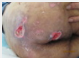
[ ] 様2月4日仙骨・右臀部.JPG